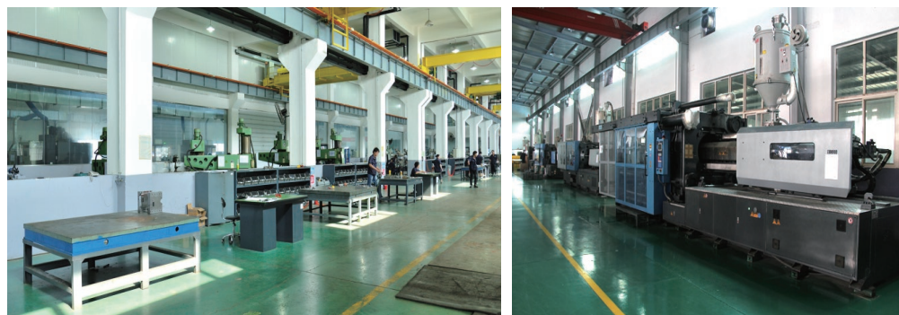
80T 到 1400T 全系类 30 余台卧式注塑机，3 台立式注塑机