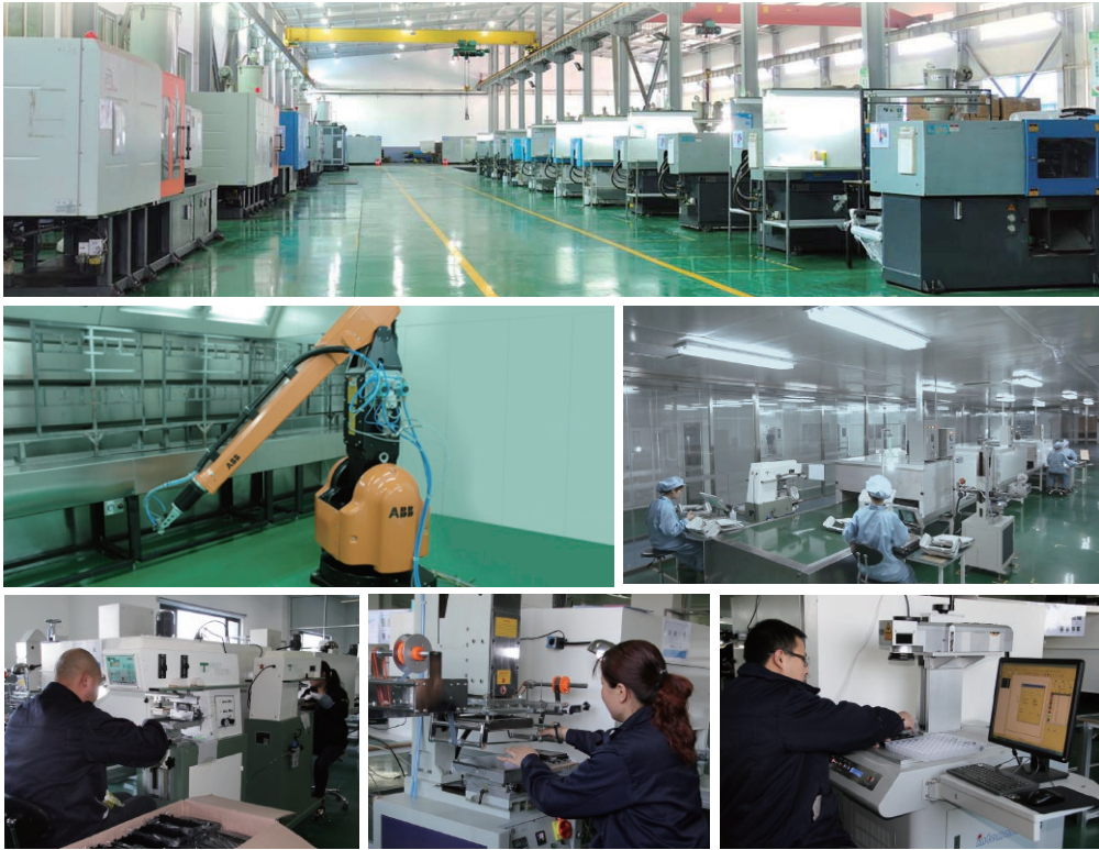
无尘自动化喷涂车间，丝印、镭雕、组装等二次加工生产线

牧野所蕴藏的力量： 员工与机器。 心脏与肌肉。 注塑与成品。 我们的喷涂、丝印、 镭雕等二次加工生产 线使各类品牌的完美 包装成为可能。