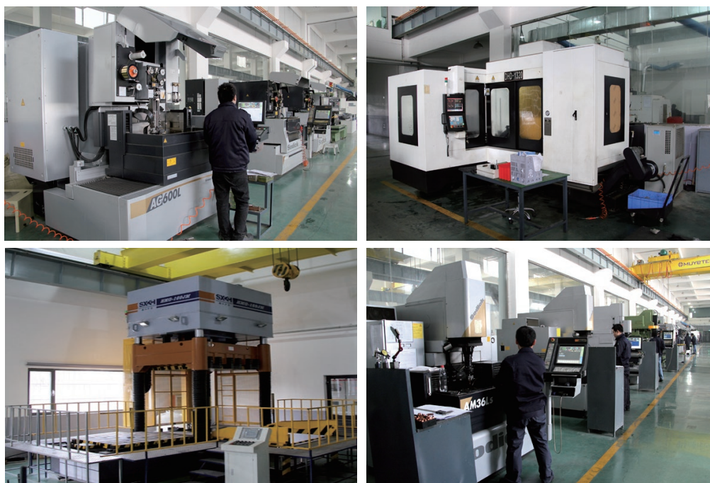
精密线切割 / 深孔钻 / 合模机