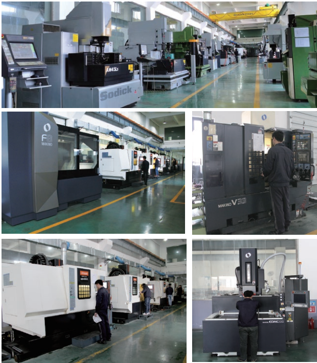
MAKINO/MAZAK 加工中心 /Sodick/MAKINO 放电机